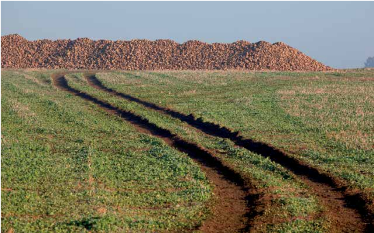
Körning under blöta förhållanden med tunga maskiner kan ge skadlig packning i alven.

Markpackning leder till en rad skördesänkande effekter. Uppptorkningen sker långsammare och tidsfönstret för vårsådden krymper. Detta visar sig främst genom att tiden mellan att jorden reder sig till att den blir torr och hård minskar, dragkraftsbehovet ökar och jorden kräver en intensivare bearbetning för att ge tillräckligt med finjord för ett bra avdunstningsskydd. Följden blir att etableringen försvåras och risken för svaga och ojämna bestånd ökar. En ökad bearbetning är förstås också både dyrt och ineffektivt ur energisynpunkt.