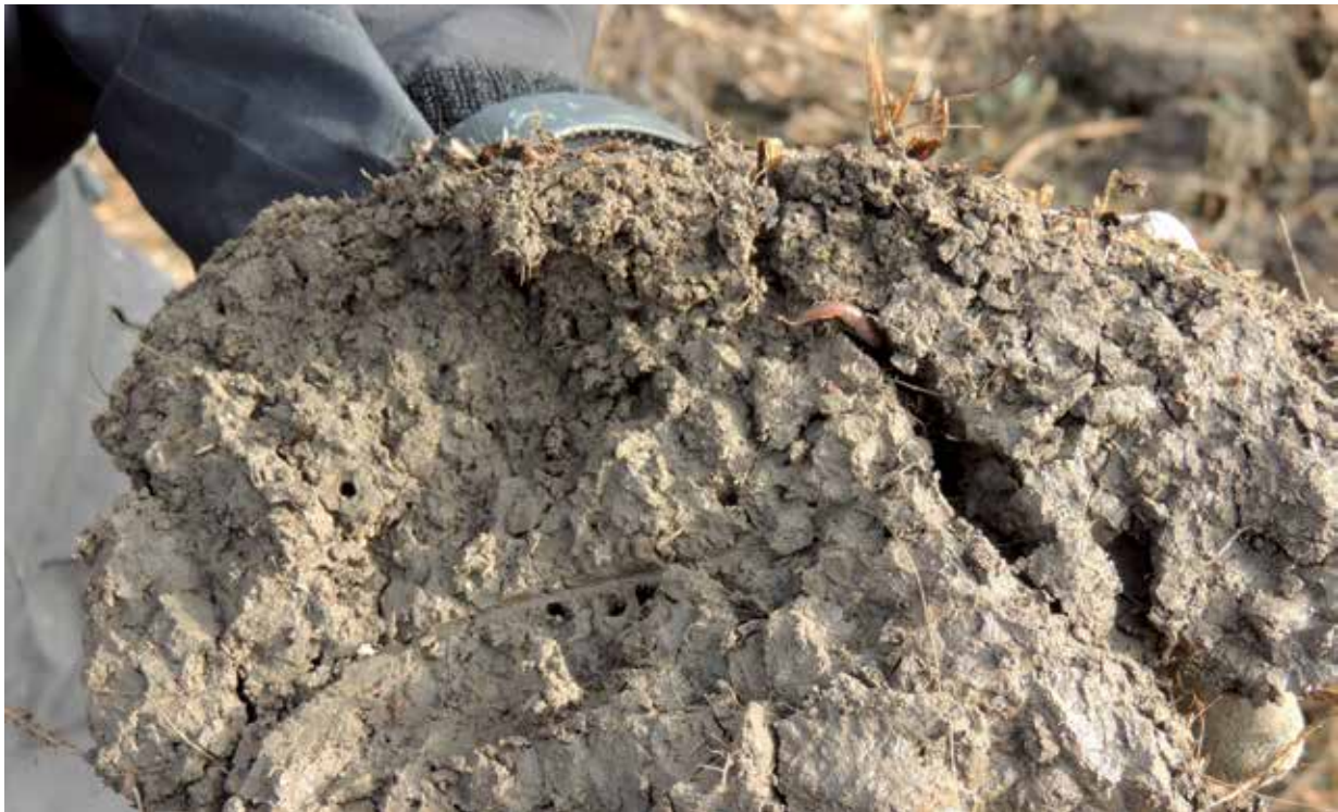
Makroporer kan vara maskgångar eller gamla rotkanaler. De är väldigt viktiga för vattentransporten i jorden.